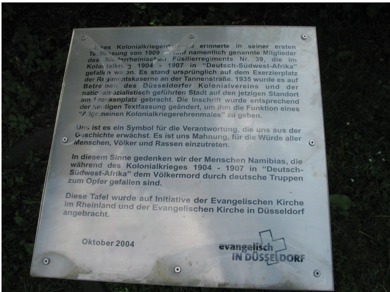
Düsseldorf, Kolonialtruppen-Denkmal: Infotafel

In Duisburg war dieser Entscheidung eine mehrere Jahre dauernde, z.T. sehr heftige öffentliche Debatte vorausgegangen. Ähnliches wäre auch zu erwarten, wenn man den Orsoyer Schützen vorschlagen würde, ihre Totenehrung an einen angemesseren Platz zu verlegen.