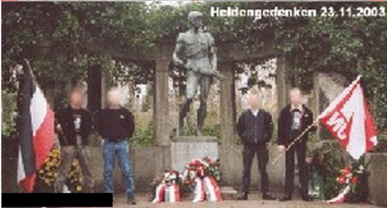
Duisburg Kaiserberg, Siegfried-Figur. Neonazi-Kränze und -Feiern