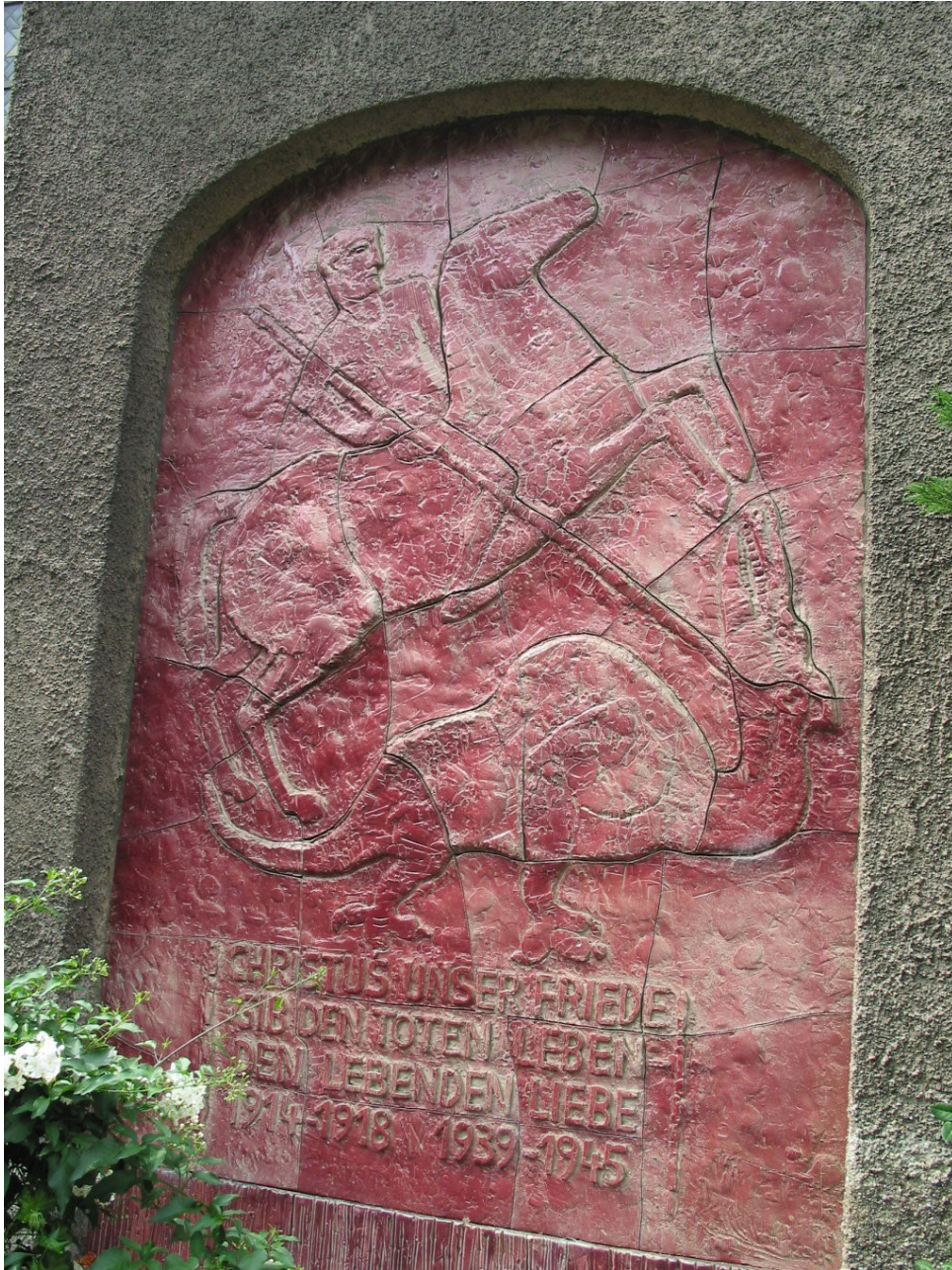
Duisburg Rahm, christlicher Drachentöter

Den nach 1945 errichteten Kriegsdenkmälern fehlt die aggressive Stoßrichtung ihrer Vorgänger. Oft werden christliche Motive verwendet.