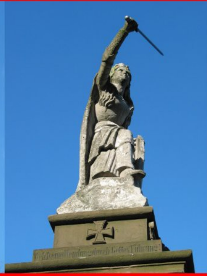
Germania in Duisburg Essenberg

In Zeit um die Jahrhundertwende wurden auch in zahlreichen anderen Städten Germania-Figuren aufgestellt. Das immer gleiche Thema wurde mit wenig Phantasie variiert, sodass man vielleicht sogar zu dem Schluss kommen könnte, es handle sich um Kitsch.