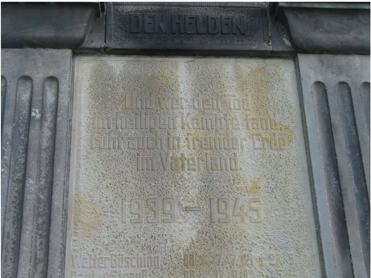
Petershagen Neuenknick (Kreis Minden-Lübbecke): „Im heiligen Kampfe“