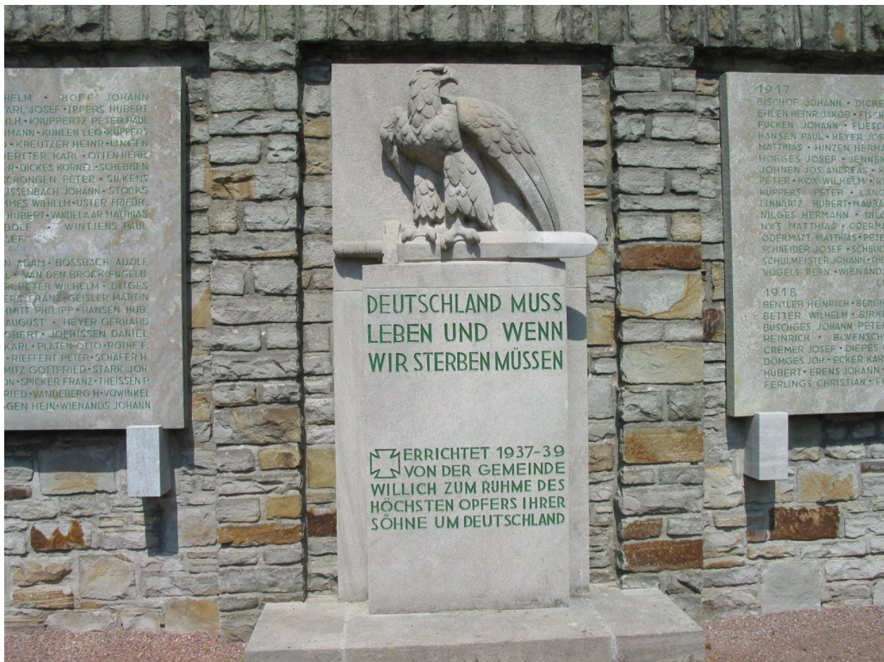
Kriegsdenkmal in Willich (bei Krefeld): Deutschland muss leben und wenn wir sterben müssen

Der Nationalsozialismus knüpfte stilistisch und inhaltlich an die Kriegsdenkmäler der 1920er Jahre an. Schon in der sogenannten ‚Kampfzeit‘ vor 1933 kopierte er den Heldenkult bei der Verehrung der sogenannten ‚Märtyrer der Bewegung‘ und inszenierte einen eigenen quasi-religiösen Kult, der beträchtlich zum Erfolg der NSDAP beigetragen hat. 10 Nach 1933 übernahm der NS-Staat in seinen Kriegsdenkmälern viele Elemente der Weimarer Zeit, spitzte sie aber aggressiv zu.