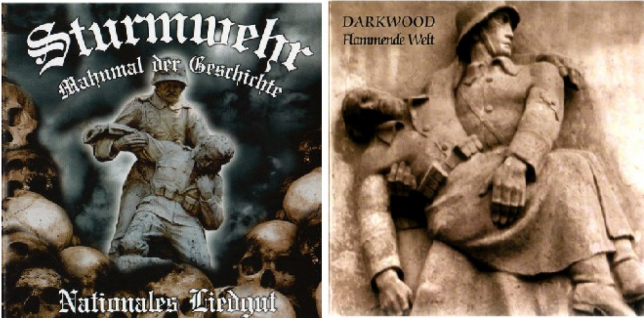
Rechtsrock CD-Cover mit Abbildungen von Kriegsdenkmälern

Es überrascht der hohe Stellenwert, der von fast allen Strömungen dieses politischen Spektrums diesem Thema zugemessen wird. Das beschränkt sich nicht auf ritualisierte Feiern wie z.B. alljährlich zum Volkstrauertag. Erinnerung sei an die regelmäßigen Aufmärsche zum Jahrestag der Bombardierung Dresdens, auf dem Soldatenfriedhof in Halbe bei Berlin oder zum sogenannten ‚Nationalen Antikriegstag‘ in Dortmund. Neuerdings wird auch der ‚Heldengedenktag‘ am 5. Sonntag vor Ostern wiederbelebt, und die NPD veranstaltet Fahrten nach Langemarck.