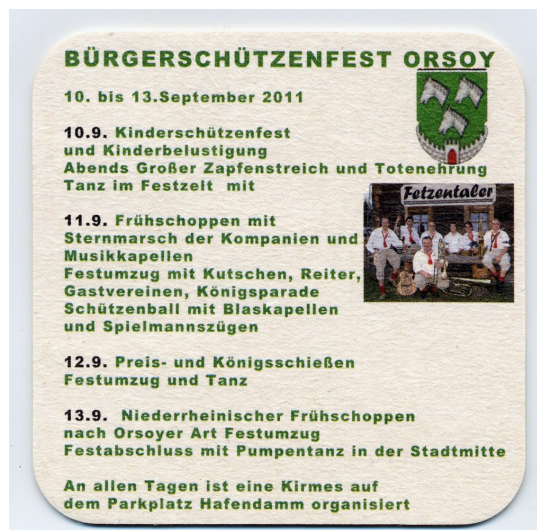
Bierdeckel, Orsoy 2011: „Abends Großer Zapfenstreich und Totenehrung“

Auf die Frage, warum man das so macht, erhält man die Antwort: „Das ist die Tradition.“