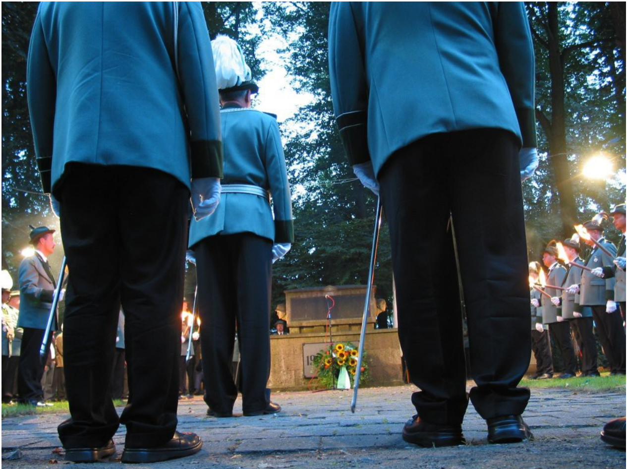
Orsoy: Großer Zapfenstreich

An diesem Denkmal findet wie in vielen anderen Gemeinden im Rahmen des alljährlichen Schützenfestes eine rituelle Feier statt. Die Schützenbrüder vollziehen das militärische Zeremoniell des Großen Zapfenstreichs.