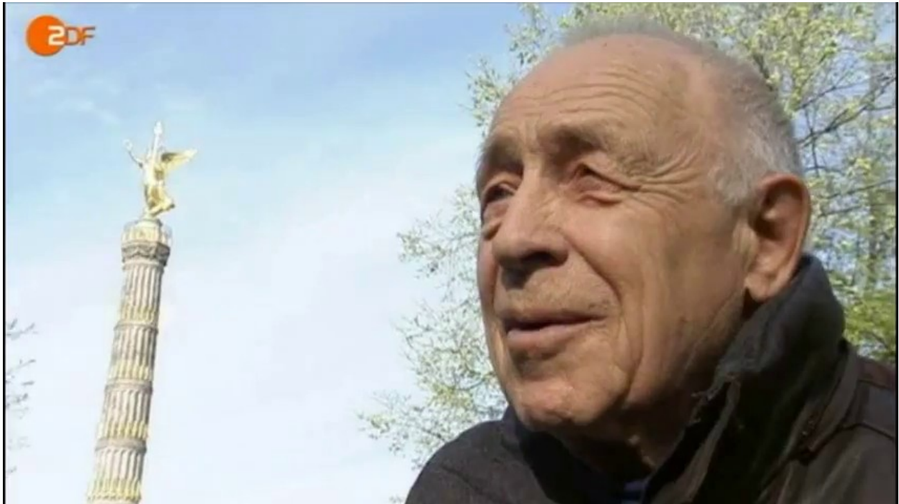
Heiner Geißler, im Hintergrund die Siegessäule

Das Vergangene ist nie tot, es ist nicht einmal vergangen. Und unsichtbare Denkmäler werden plötzlich wieder sichtbar.