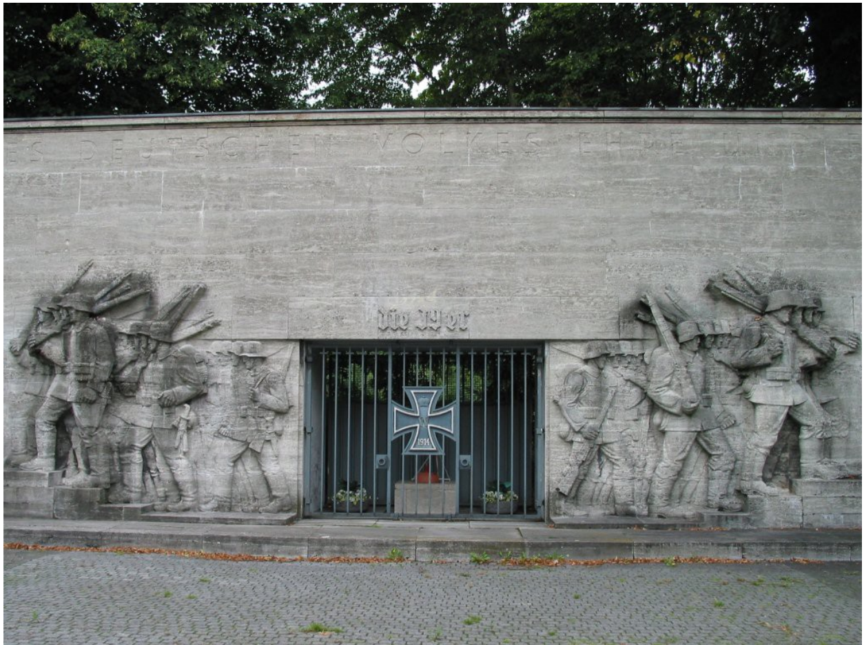
Die toten Soldaten aus dem Ersten Weltkrieg marschieren aus der Gruft in den Zweiten Weltkrieg