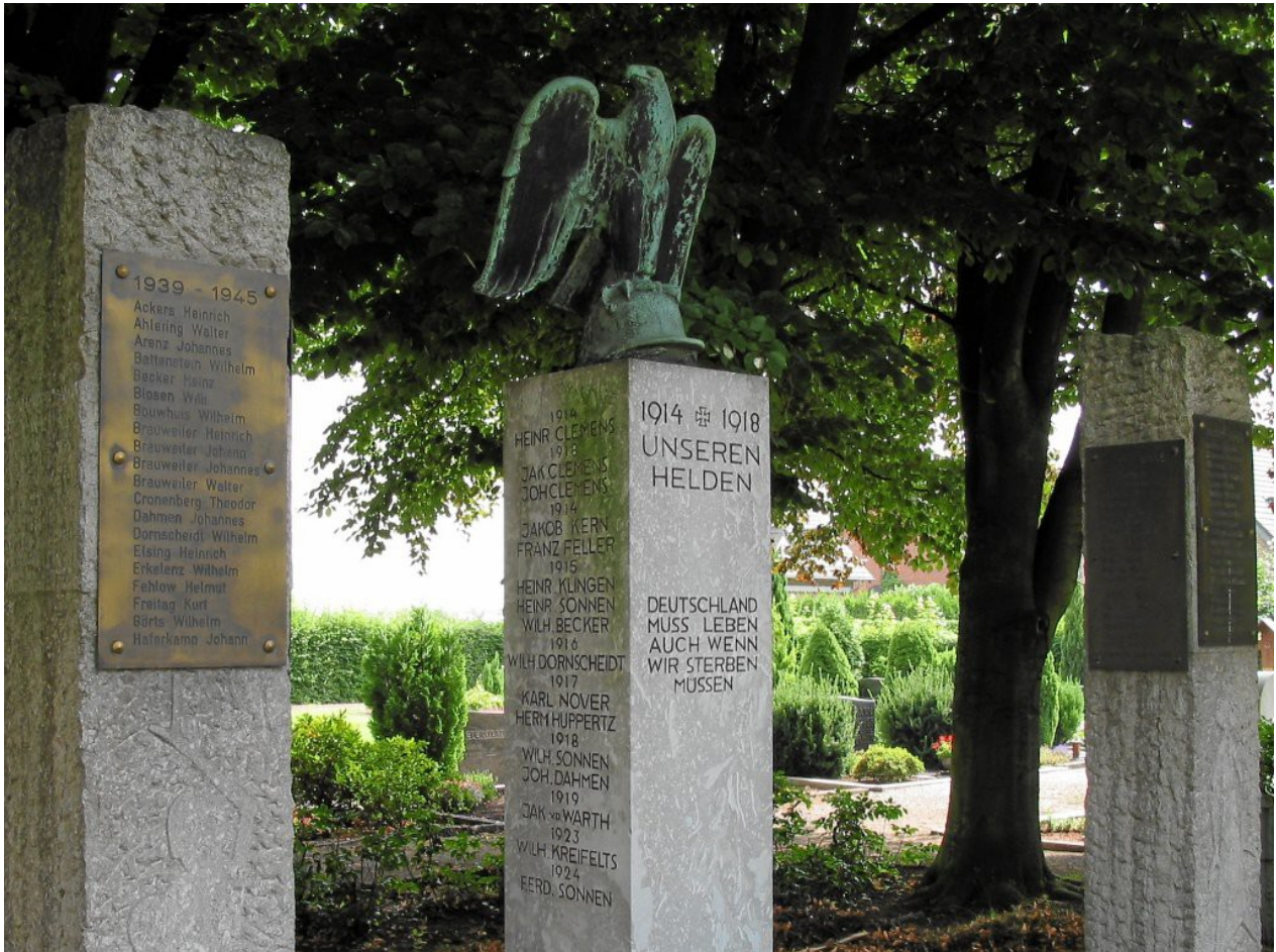
Duisburg Mündelheim: „Deutschland muss leben auch wenn wir sterben müssen“

In Duisburg Mündelheim findet man eine Säule mit Adler auf Stahlhelm. Sie ist mit der Inschrift „1914-1918 / Unseren Helden“ beschriftet und trägt die häufig verwendete höchstproblematische Gedichtzeile von Heinrich Lersch