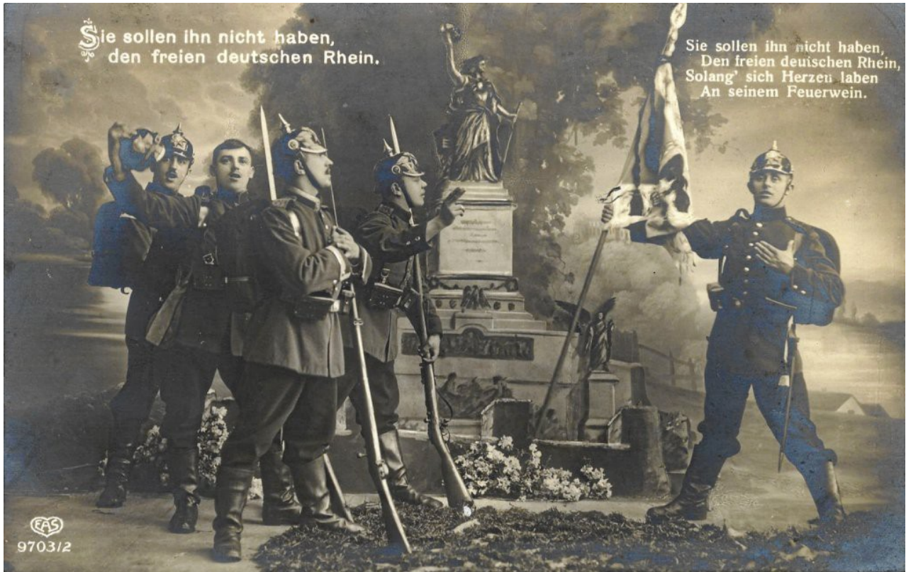
Kriegspostkarte 1914 mit Niederwalddenkmal 5

„Sie sollen ihn nicht haben, den freien deutschen Rhein“