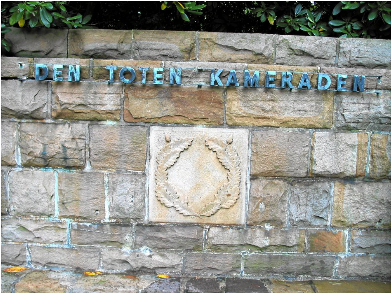
Duisburg Wanheim, Waldfriedhof: Bei feuchtem Wetter schimmert das Hakenkreuz durch

Weitaus häufiger als durch Errichtung neuer Denkmäler wurden die alten Denkmäler durch kleine Modifikationen angepasst und weiter genutzt. So wurden NS-Symbole entfernt, aber manchmal schimmert das Hakenkreuz auch heute noch durch.