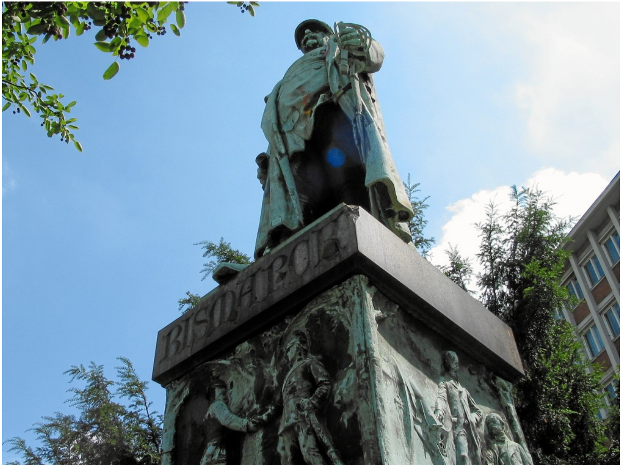
Bismarck-Denkmal in Essen. Unten rechts: Krupp, Bismarck und Kanone

Dabei gäbe es hier nicht nur für Bismarckverehrer, sondern auch für Gegner des eisernen Kanzlers interessantes zu entdecken. Zu sehen ist ein finsterner Bismarck mit Säbel und in Reitstiefeln. Auf dem Sockel ist abgebildet, wie Krupp Bismarck eine Kanone verkauft.