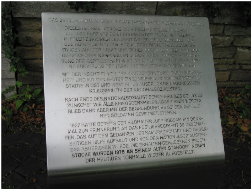
Düsseldorf, Denkmal am Reeser Platz: Infotafel