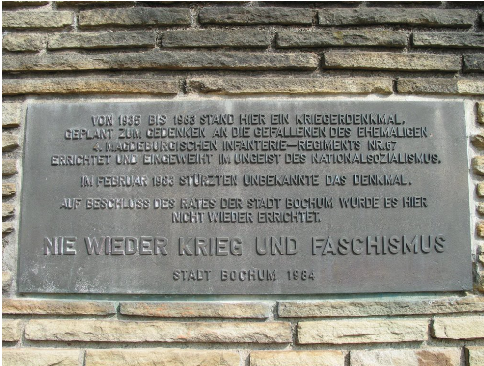
Bochum: Kriegsdenkmal am Eingang zum Stadtpark

Auch wenn solche Denkmäler und Gedenkstätten keinen unmittelbaren Bezug zu Kriegsdenkmälern aufweisen, kann man sie sehr wohl als Gegendenkmäler auffassen. Als sehr frühes Beispiel aus den 60er Jahren sei das Denkmal in der Bittermark in Dortmund erwähnt (ein kontrastierender Vergleich dieses Denkmals mit der Kriegsdarstellung von Gefallenen Denkmälern wäre ein lohnendes Projekt). Eine ganz andere Form des Gedenkens repräsentieren auch die sogenannten Stolpersteine, die in vielen Städten auf dem Bürgersteig vor den Wohnungen in der NS-Zeit Ermordeter eingelassen werden.