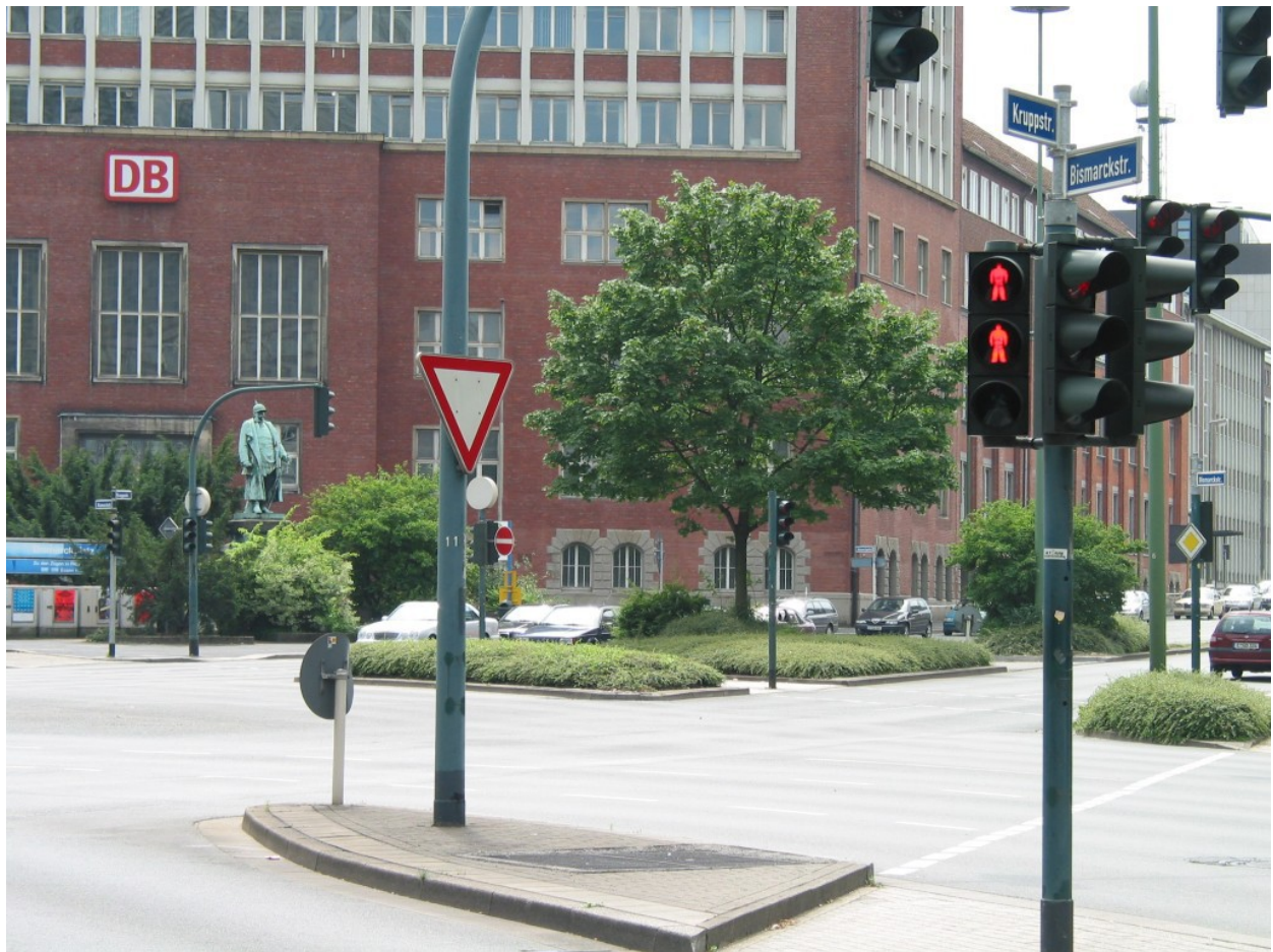
Bismarck-Denkmal in Essen

Dort, wo in Essen die Kruppstraße und die Bismarckstraße sich kreuzen, beherrscht eine überlebensgroße Bismarck-Statue den vielbefahrenen Platz – und wird vermutlich von niemandem wirklich wahrgenommen.