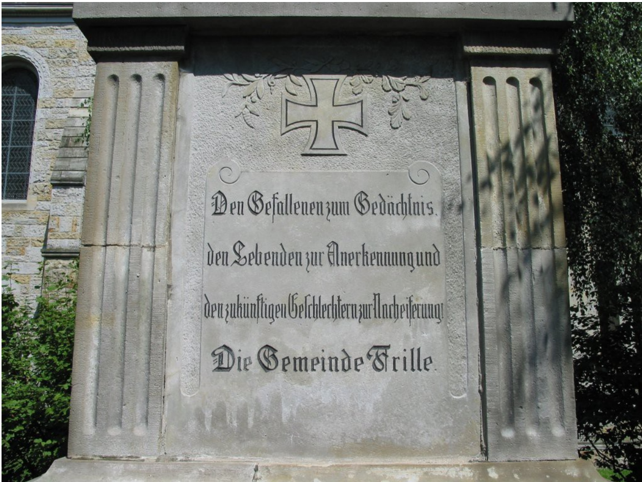
„Zur Nacheiferung“ - Inschrift in Frille (bei Minden)

Trauer um die Toten. Die Denkmäler weisen in die Zukunft: Zukünftige Generationen hätten die Pflicht, eines Tages ebenfalls für's Vaterland zu sterben.