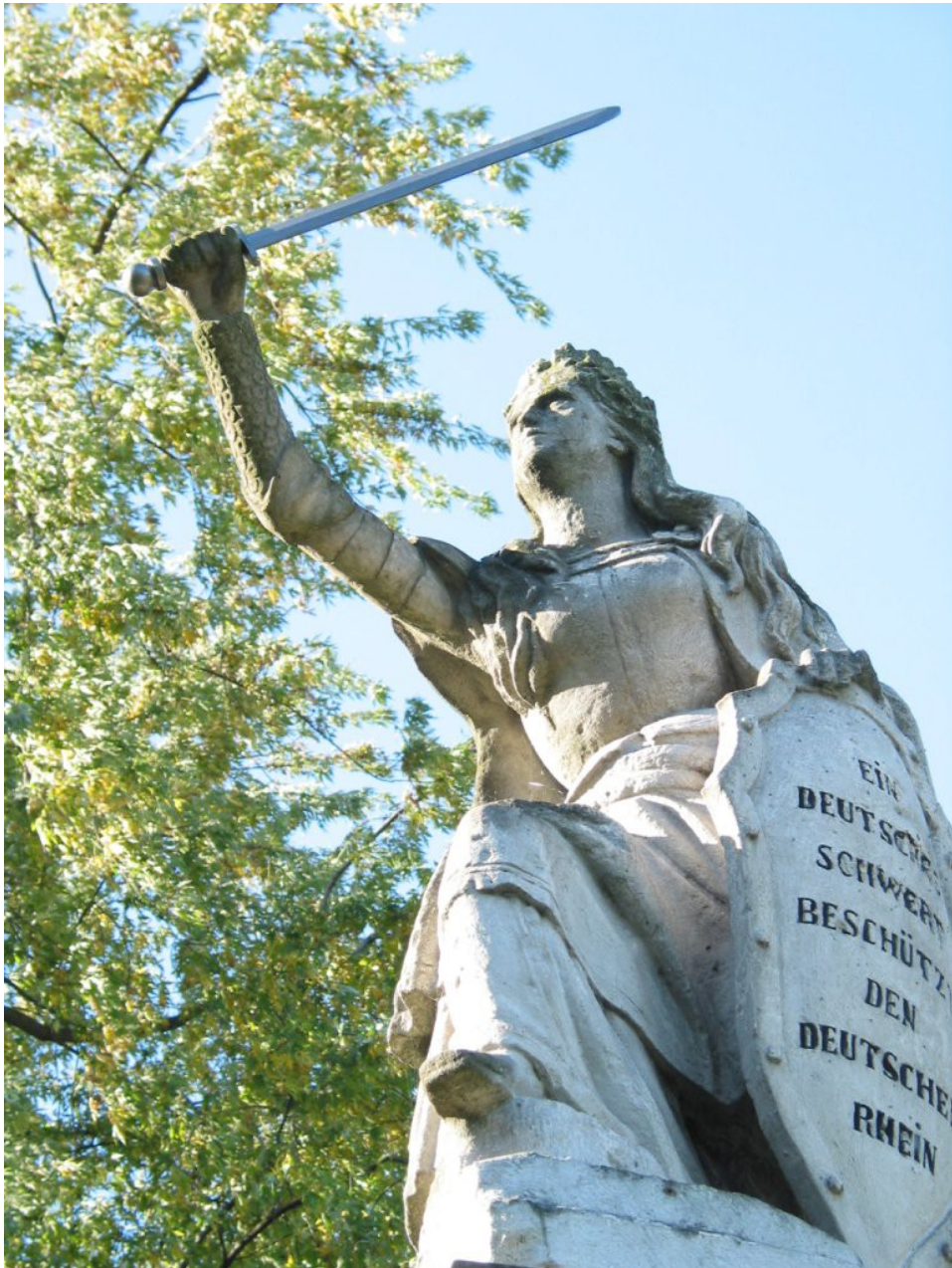
Germania Duisburg Essenberg: Ein deutsches Schwert beschützt den deutschen Rhein

Kriegervereine, Turnerbewegung und Burschenschaften waren die Hauptträger des wilhelminischen Denkmalbooms.