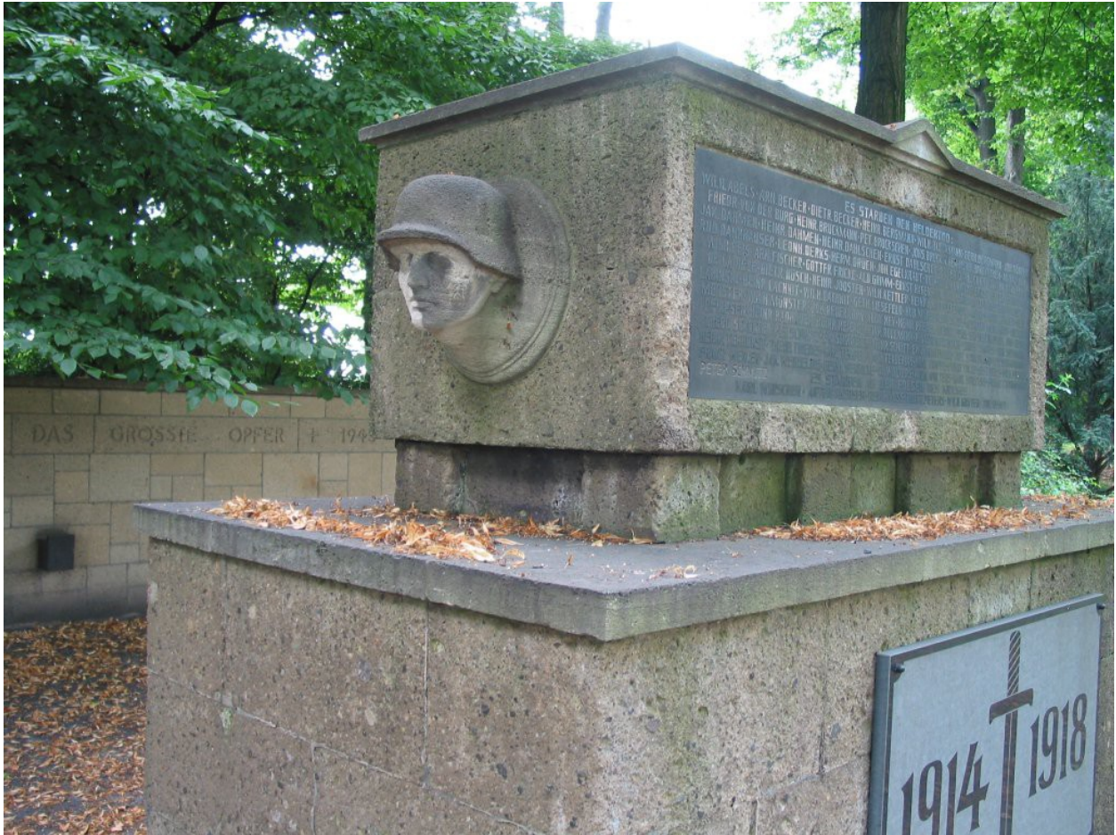
Orsoy: „Sie brachten das größte Opfer“

Auf dem Kriegsdenkmal in Orsoy am Niederrhein, einem Katafalk aus dem ein Kopf mit Stahlhelm ragt, findet man in Bezug auf den Ersten Weltkrieg die Formel