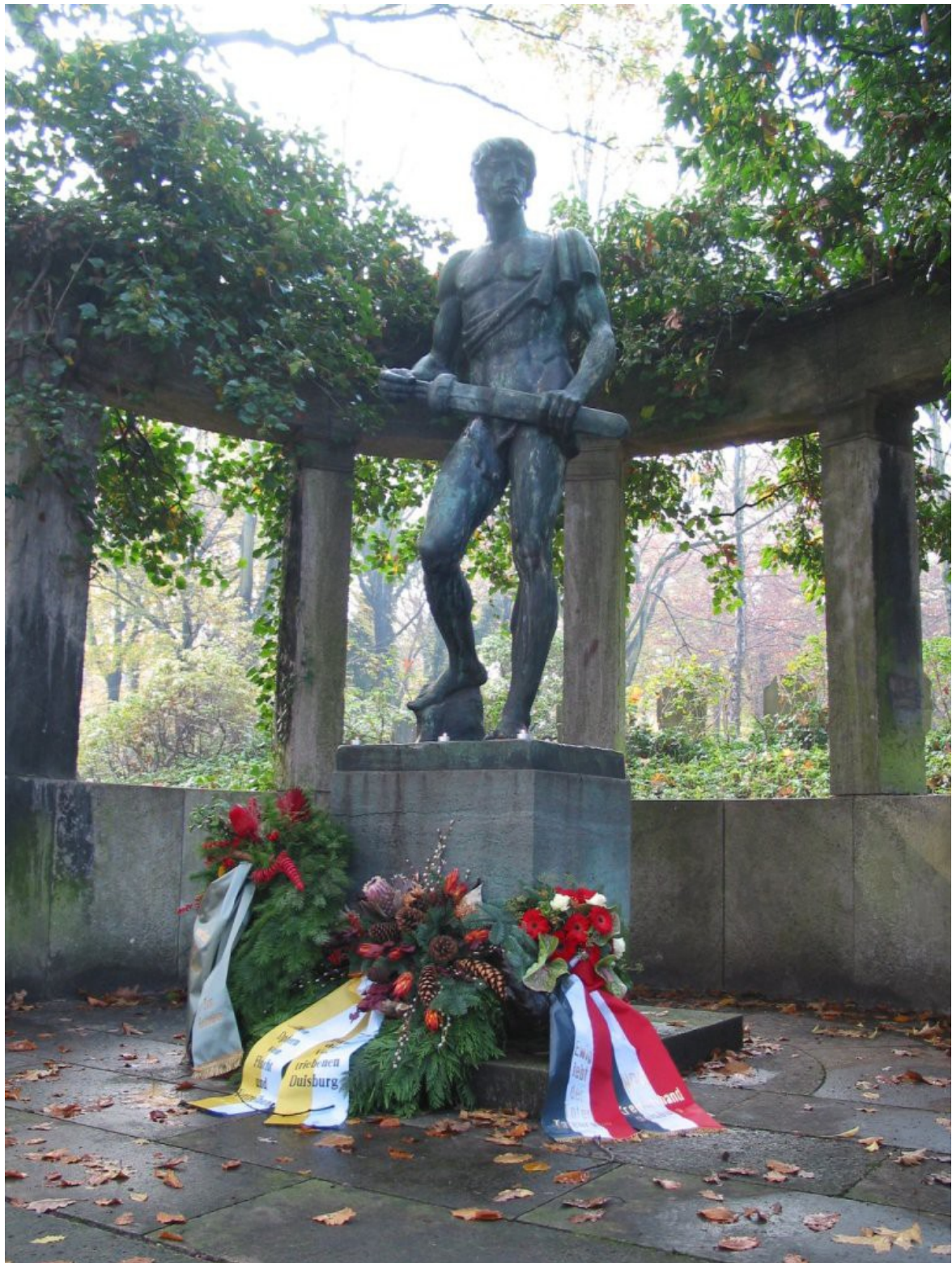
Siegfried-Figur, Duisburg Kaiserberg (mit Kränzen des Bundes der Vertriebenen und der NPD)

Auf diesem Foto sieht man die Siegfried-Statue auf dem Soldatenfriedhof mit Lazarett-Toten aus dem Ersten Weltkrieg auf dem Kaiserberg.