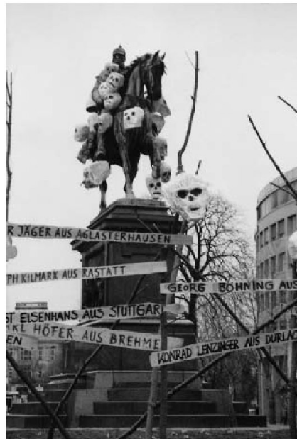
Abbildung 5: Das Karlsruher Kaiserdenkmal für Wilhelm I., Reiterstandbild von Adolf Heer aus dem Jahre 1897, Foto 1998 mit Inszenierung von Schülern des Markgrafengymnasiums Durlach in Anspielung auf die 1849 von den Preußen standrechtlich erschossenen Freiheitskämpfer