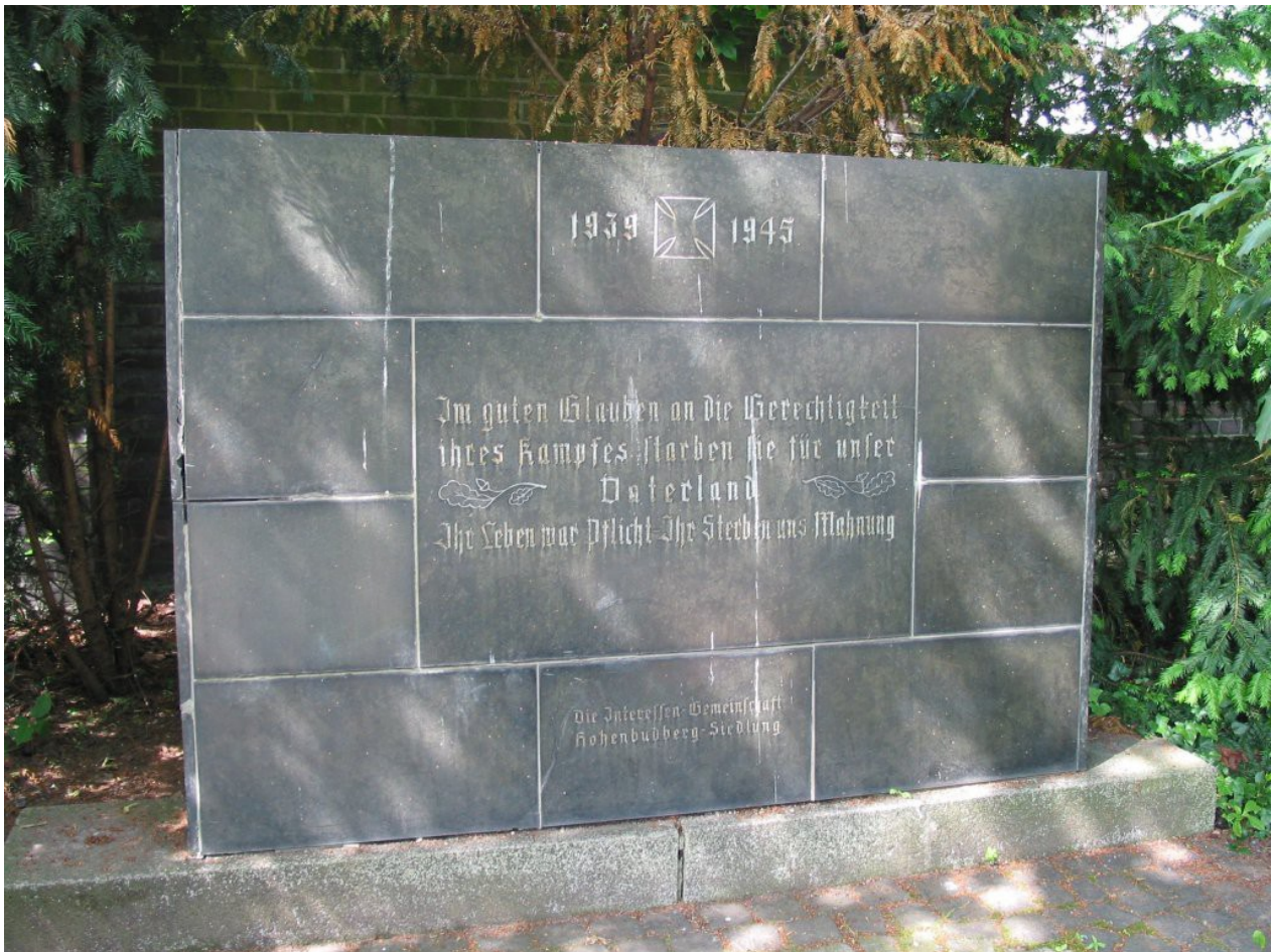
Duisburg Hohenbudberg: „Im guten Glauben an die Gerechtigkeit ihres Kampfes“

Andere Nachkriegsinschriften lauten beispielsweise: