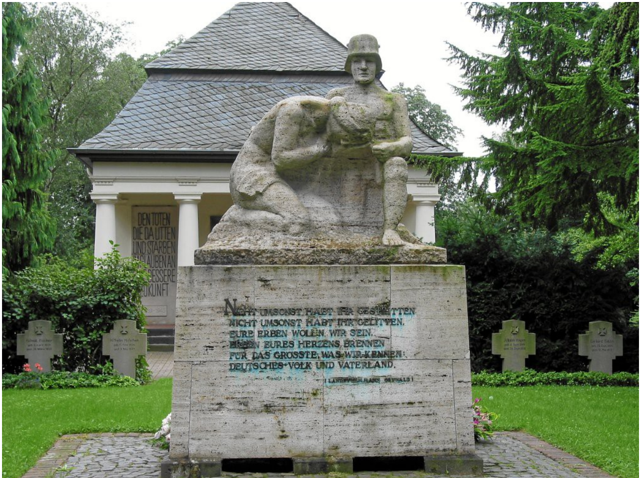
Duisburg Rumeln: „Eure Erben woll'n wir sein“

Häufig wurden an den alten Denkmälern einfach nur zusätzliche Inschriften für den Zweiten Weltkrieg angebracht.