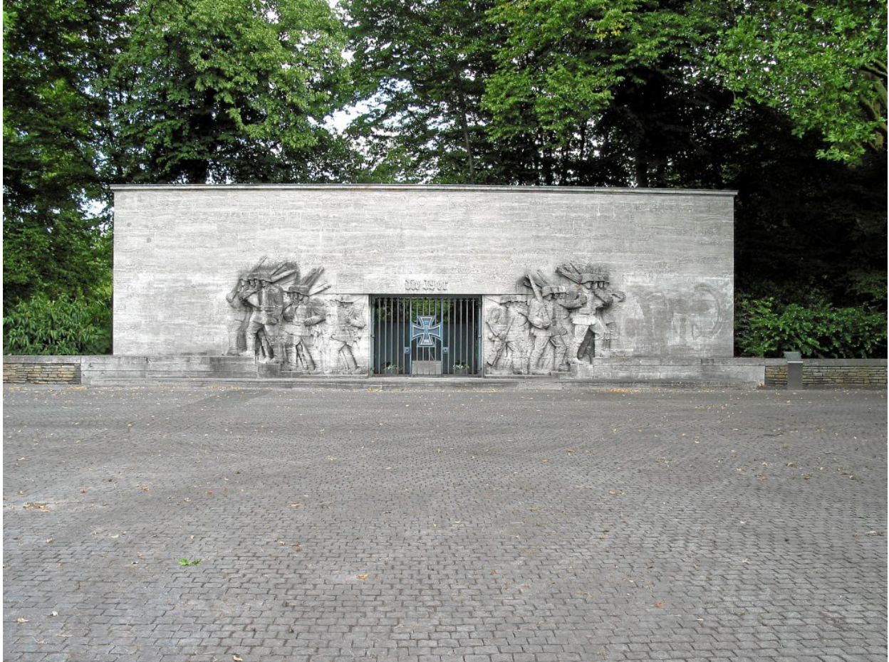
Kriegsdenkmal von 1939, Düsseldorf, Reeser Platz (mit großem Aufmarschplatz für NS-Feiern)

Wie Erich Ludendorff gefordert hatte, errichteten die Nazis ein neues Denkmal, und zwar am Reeser Platz am Düsseldorfer Rheinufer. Der alte Platz vor der Tonhalle war zu klein. Die Nazis benötigten für ihre Zwecke einen riesigen Aufmarschplatz.