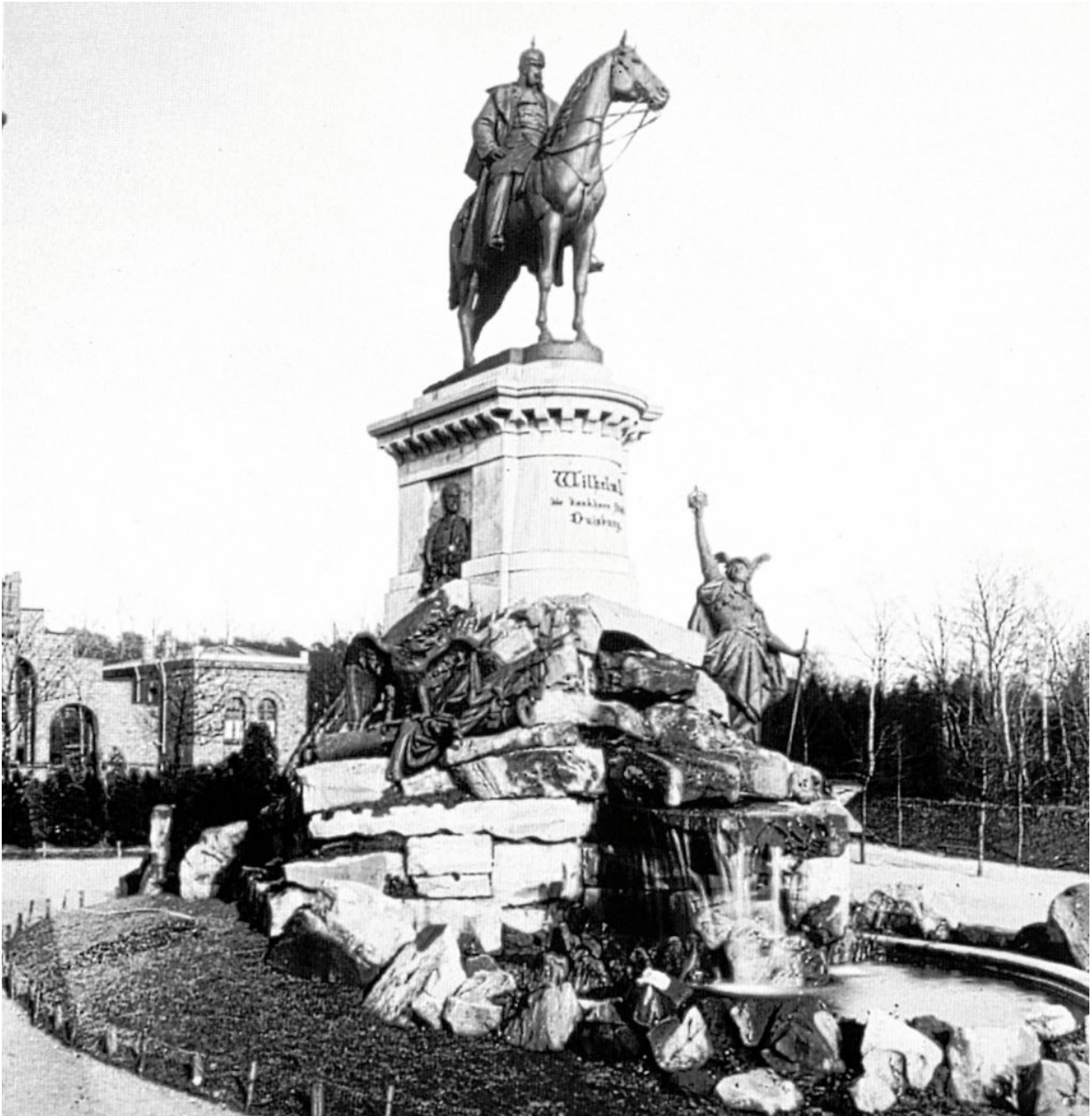
Kaiser Wilhelm Denkmal, Duisburg Kaiserberg 9

Jede Stadt hatte mindestens ein Kaiser-Wilhelm-Denkmal.