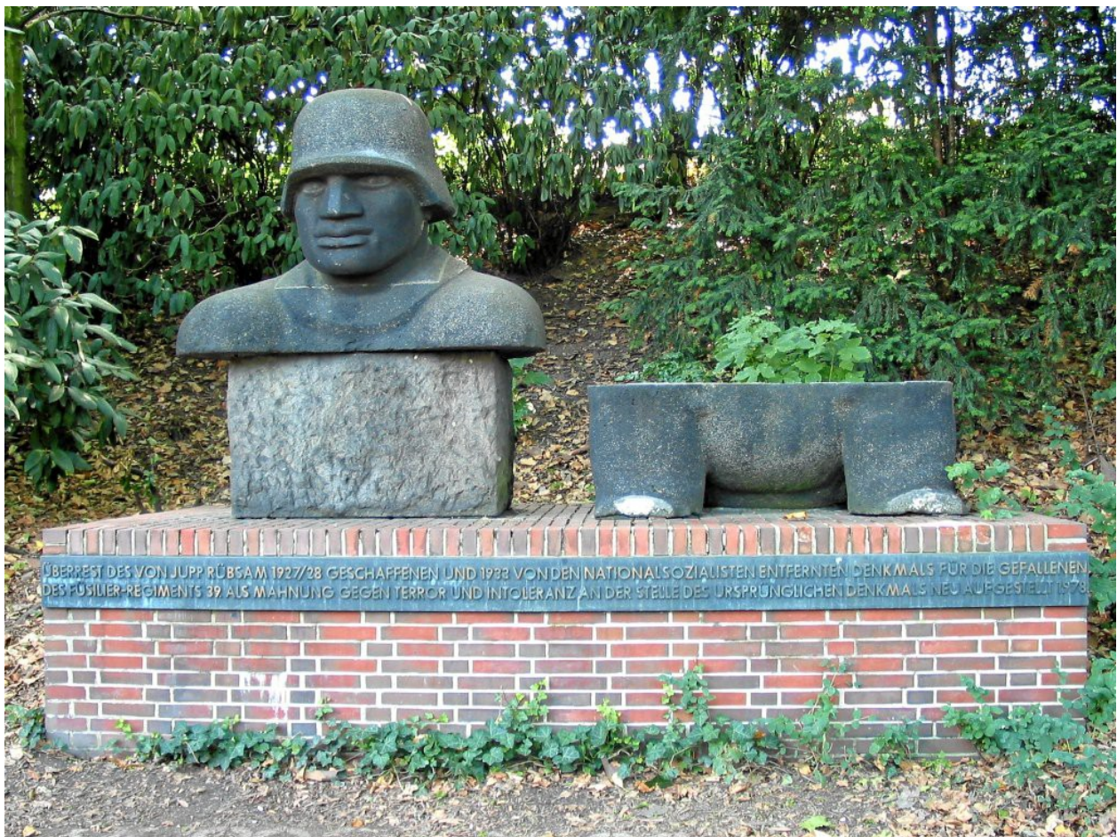
Mahnmal vor der Düsseldorfer Tonhalle mit den Überresten des zerstörten Rübsam-Denkmal

Es gab in der Folgezeit neben unzähligen Schmähungen mehrere Schändungen und sogar einen Sprengstoffanschlag auf dieses Denkmal. Eine zeitgenössische Quelle legte sogar nahe, die NS-Kunstauffassung habe sich erst in der Auseinandersetzung mit diesem Denkmal herausgebildet und ‚deutsche Kunst‘ von ‚entarteter Kunst‘ zu scheiden gelernt. 13