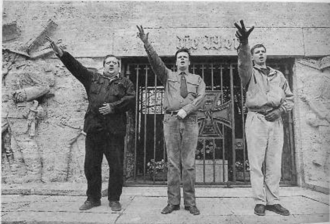
Neonazis vor dem Denkmal am Reeser Platz in Düsseldorf (Pressefoto)

Sehr viel gefährlicher als solch eine unreflektierte Brauchtumpflege sind die Reaktualisierungsversuche des politischen Totenkults durch die extreme Rechte.