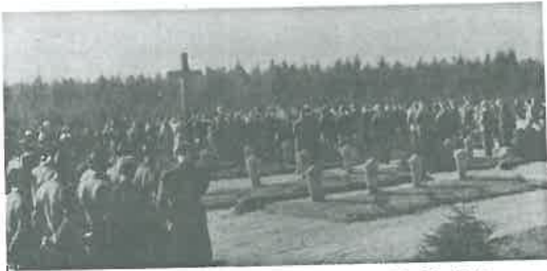
Einweihung des Ehrenfriedhofes Oderbrück 28. 09. 1946