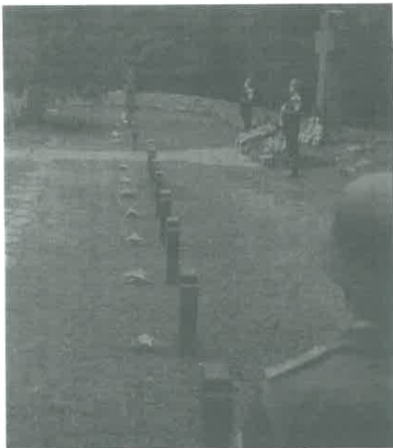
Ehrenposten während der Gedenkfeier am Volkstrauertag 1982