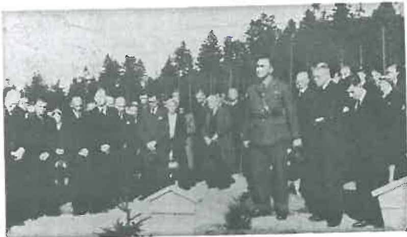
Vertreter der britischen Militärregierung nahmen an der Einweihungsfeier teil.