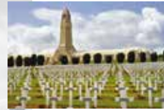
Französischer Soldatenfriedhof, Verdun