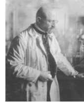
Der Chemiker und Nobelpreisträger Fritz Haber

Staatbürger jüdischen Glaubens veröffentlichten am 1. August 1914 folgenden Aufruf: „Glaubensgenossen! Wir rufen Euch auf, über das Maß der Pflicht hinaus Eure Kräfte dem Vaterlande zu widmen. Eilet freiwillig zu den Fahnen! Ihr alle – Männer und Frauen – stellt Euch durch persönliche Hilfeleistung jeder Art und durch Herabgabe von Geld und Gut in den Dienst des Vaterlandes!“