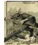
Das Bild des deutschen Soldaten in der französischen Kriegspropaganda

Die Alliierten begründeten in ihren Veröffentlichungen ihren Kriegseinsatz mit dem brutalen Vorgehen der Deutschen. Die Betonung der Grausamkeit der deutschen Soldaten sollte der eigenen Bevölkerung die Notwendigkeit des Kriegs immer wieder vor Augen führen. Die deutsche Propaganda stellte hingegen oft das Selbstbild der Deutschen als überlegenes Kulturvolk heraus, das noch im Krieg seine Feinde gerecht behandelte. Auch in den für das feindliche Ausland gedachten Schriften erschien dieses Bild. Deutschland als unschuldiges Opfer, das eben aufgrund seiner Überlegenheit angegriffen wurde.