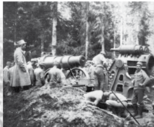
Der Krieg in den Alpen: ein österreichischer Marsch

Der Kampf der Alliierten gegen die Türkei berührte auch den Nahen und Mittleren Osten. Großbritannien annektierte in November 1914 Zypern und erklärte im Dezember Ägypten zu seinem Protektorat. Von dort erfolgten Vorstöße auf das Ostufer des Suezkanals. Briten und Araber eroberten die osmanische Provinz Syrien und die Region, in der später der Irak entstand. Die Besetzung Persiens folgte. Die Dardanellen, eine strategisch wichtige Meerenge zwischen der Ägäis und dem Marmarameer, blieben jedoch in türkischer Hand. Auch Türkisch-Armenien eroberten türkische Truppen nach einem zunächst erfolgreichen russischen Vorstoß 1916 zurück.