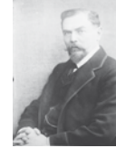
Der Pazifist Alfred Hermann Fried

Sozialdemokratische Reichstagsabgeordnete 1917 in Stockholm auf dem Weg zu einem internationalen Sozialistenkongress, rechts Friedrich Ebert