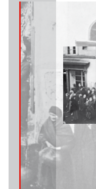
Rechtes Bild Lebensmittelausgabe an die Zivilbevölkerung im Jahr 1918

Im Jahr 1915 führte Deutschland die Rationierung und Zwangsbeschäftigung von Nahrungsmitteln ein. Ihren Höhepunkt erreichten die Versorgungsschwierigkeiten im Winter 1916/17. Aus Mangel an Arbeitskräften konnten viele Agrarflächen nicht bewirtschaftet werden. Die Kartoffelfilaxie lag nur bei 50 Prozent des durchschnittlichen Ertrags. Als Ersatz gab man rationierte Kohl- oder Steckrüben aus. Eine Seeblockade durch die britische Marine machte Importe weitgehend unmöglich. Im Sommer 1917 standen den Deutschen pro Kopf täglich etwa 1.000 Kalorien zur Verfügung. Der Bedarf lag bei 2.280. Zwischen 1914 und 1918 starben in Deutschland mehr als 700.000 Menschen an Hunger und Unterernährung.