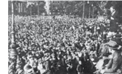
Die politische Auseinandersetzung fand auch auf der Straße statt: Demonstration der USPD in Berlin, 1920

Die erste Republik auf deutschem Boden, ausgestattet mit einer freiheitlichen Verfassung, scheiterte an permanenten Angriffen der Rechten und Linken sowie an mangelnder Unterstützung durch die bürgerliche Mitte. Große Teile der Bevölkerung befanden sich in einer fortwährenden Notlage und waren damit empfänglich für politische Propaganda und radikales Gedankengut, zumal niemand die Kriegsschuld anerkennen wollte. Zwar konnten die ungeheuren Reparationsverpflichtungen auf dem Verhandlungsweg vermindert werden, aber auch das stabilisierte die Republik nicht dauerhaft.