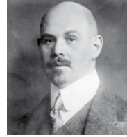
Linkes Bild Der Großindustrielle Walther Rathenau