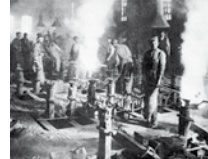
Granatengießerei in den Krupp-Werken