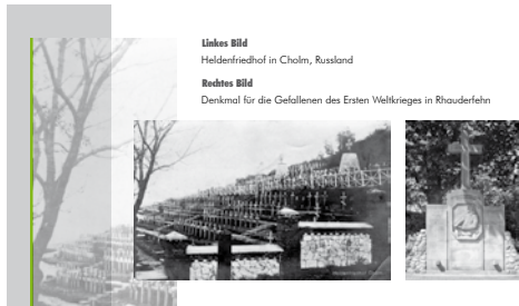
Linkes Bild: Heldenfriedhof in Cholm, Russland Rechtes Bild: Denkmal für die Gefallenen des Ersten Weltkrieges in Rhaderfeln

Das EIZ Niedersachsen ist als Teil der Niedersächsischen Staatskanzlei in Hannover Anlaufstelle für Europa-Themen aller Art. Zugleich ist es Teil des Europe Direct-Netzwerkes der Europäischen Kommission mit rund 500 Informationszentren in den Mitgliedstaaten der Europäischen Union. Ziel des EIZ Niedersachsen ist es, den Bürgerinnen und Bürgern (besonders auch Schülerinnen und Schülern) in Niedersachsen Europa und die Europäische Union als Garant für Frieden und Wohlstand in Europa näherzubringen. Zu diesem Zweck hält das EIZ Niedersachsen Informationsmaterial bereit, organisiert Veranstaltungen zu aktuellen Europa-Themen und steht mit einem kompetenten Team für die Beantwortung von Fragen und für Vorträge zu europäischen Themen zur Verfügung. www.eiz-niedersachsen.de