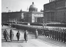
In der Zeit der NS-Diktatur hieß der Volksvertrag, dessen Begehung der Volksbund zur Ehrung der Gefallenen 1919 angeregt hatte, „Heldengedenktag“

Viele Kriegsteilnehmer fanden nach 1918 nur schlecht in das Alltagsleben zurück. Auch diejenigen, die nicht als Kriegsverletzte oder Invaliden nach Hause kamen, waren schwer traumatisiert. Hinzu kam die allgemeine Notlage, in der sich die deutsche Bevölkerung nach dem Krieg befand. So verklangen sich allmählich die Erinnerungen an die Gräueltaten des Krieges. Nationalsozialistische und nationalistische Demagogen nutzten die Situation, um ihre Vorstellungen von Revanche zu verbreiten, die Menschen zu radikalisieren und auf einen neuen Krieg einzustimmen. In konservativen und nationalistischen Kreisen verbreitete sich die „Dolchstoßlegende“. Demnach war das deutsche Heer bis zum Schluss unbesiegt geblieben und nur die mangelnde Unterstützung aus der Heimat hatte zur Niederlage geführt. Als Sündenböcke dienten dabei die Sozialdemokraten, Kommunisten und Gewerkschafter.