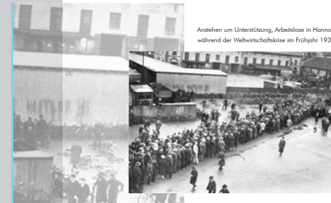
Anstehen um Unterstützung, Arbeitslose in Hannover während der Weltwirtschaftskrise im Frühjahr 1932

Nach Ende der Inflation verbesserte sich die Situation in Deutschland. Doch die mit dem „Schwarzen Freitag“, dem Zusammenbruch der New Yorker Börse am 25. Oktober 1929, einsetzende Weltwirtschaftskrise beendete faktisch die parlamentarische Phase der Weimarer Republik und bereitete den Boden für eine weitere politische Radikalisierung. In den Jahren 1930 bis 1933 griffen die Kabinette immer häufiger auf die Unterstützung des Reichspräsidenten zurück und regierten mit Notverordnungen. Ab 1932 bestand eine reine Präsidialregierung. Im Juli 1932 wurde die NSDAP stärkste Kraft im Reichstag. Im Januar 1933 stand Adolf Hitler an der Spitze einer Koalitionsregierung. Die Nationalsozialisten beseitigten in der Folgezeit die Republik und etablierten das „Führerprinzip“ in allen Bereichen des gesellschaftlichen Lebens. Die nationalsozialistische Diktatur führte direkt in den Zweiten Weltkrieg.