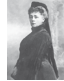
Die Pazifistin Bertha von Suttner

Nach Kriegsbeginn entwickelten sich in mehreren europäischen Ländern neue Friedensorganisationen. In Deutschland hatte die 1892 von Bertha von Suttner und Alfred Hermann Fried gegründete Deutsche Friedensgesellschaft bis Kriegsausbruch vergeblich versucht, die nationalstaatliche Konfrontationspolitik zu korrigieren. Am 16. November 1914 entstand in Berlin der „Bund Neues Vaterland“. Dieser dachte in europäischen Dimensionen und formulierte als wichtigstes Ziel „die direkte und indirekte Förderung aller Bestrebungen, die geeignet sind, die Politik und Diplomatie der europäischen Staaten mit dem Gedanken des friedlichen Wettbewerbs und des überstaatlichen Zusammenschlusses zu erfüllen, um eine politische und wirtschaftliche Verständigung zwischen den Kulturvölkern herbeizuführen“.