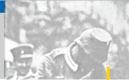
Linkes Bild Auf dem Weg in den Krieg: Aufbruch der Truppen in Paris