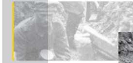
Deutsche Soldaten bei der Wiederbesetzung eines Schützengrabens

Anders als die vorangegangenen Kriege war der Erste Weltkrieg ein industriell geführter Krieg. Die beteiligten Staaten boten Millionenheere auf und steigerten die Produktion von Kriegsgütern bis zur völligen Erschöpfung ihrer wirtschaftlichen Kapazitäten. Die großen Materialschlachten an der Westfront – bei Ypern, in der Champagne, bei Verdun und an der Somme – zogen sich über Monate hin. Die Verluste an Menschenleben und Material erreichten bislang unvorstellbare Ausmaße. Der „Grabenkrieg“ an der Westfront wurde zum Sinnbild des Ersten Weltkrieges.