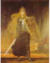
F. A. von Kaulbach: Deutschland August 1914. Die „Germania“ verkörpert Deutschlands Kampfvereitschaft zu Beginn des Ersten Weltkrieges

In sehr unterschiedlicher Weise sahen und erlebten viele Künstler den Ersten Weltkrieg. Dieser fiel in eine ausgesprochen vitale Phase der Kunst in Europa und beeinflusste diese wiederum stark. Viele Avantgardisten zogen mit großer Begeisterung in den Krieg und hofften auf Inspiration. Der Maler Franz Marc erwartete vom Krieg „Reinigung und Erneuerung“. Ein tödlicher Irrtum. Einige Künstler brachten schon Jahre vor Kriegsausbruch apokalyptische Vorahnungen zum Ausdruck. Andere glorifizierten den Kampf und sahen sich nach ihrer Einberufung rasch ermüdet. Viele, die den Krieg überlebten, erholten sich psychisch nicht mehr davon.