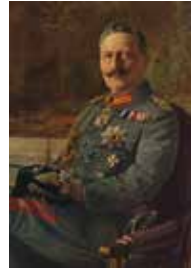
Kaiser Wilhelm II. betrieb Weltpolitik. Bei der Verteilung der Kolonialgebiete beanspruchte er für Deutschland einen „Platz an der Sonne“

Um 1880 begann eine neue Phase der Kolonialpolitik. Am Wettlauf der europäischen Großmächte um die wirtschaftliche und politische Aufteilung der Welt beteiligten sich auch Japan und die USA – das Ziel: die endgültige Entscheidung über Gleichgewicht, Reichtum und Macht der Nationen. Hintergrund dieser Entwicklung waren die Industrialisierung und die Herausbildung des Finanzkapitalismus im 19. Jahrhundert. Die häufig betonte wirtschaftliche Bedeutung der Kolonien als Rohstofflieferanten und Absatzmärkte blieb gering. Deutschlands koloniale Aktivitäten nahmen zu, nachdem Wilhelm II. den Thron bestiegen hatte. Zur Maxime der deutschen Außenpolitik wurde das Streben nach Weltgeltung, der Flottenbau galt als Mittel, diese zu erreichen.