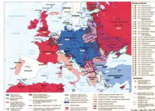
Europa im Ersten Weltkrieg

Deutschlands Strategie im Zweifrontenkrieg war, im Westen gegen Frankreich einen schnellen Sieg zu erringen und dann seine Kräfte im Osten gegen Russland zu konzentrieren. Doch der Plan scheiterte, unter anderem weil Belgien sich gegen die Verletzung seiner Neutralität wehrte. Brutale Übergriffe deutscher Soldaten auf die Zivilbevölkerung forderten im August 1914 über 6.000 Opfer und führten zur Massenflucht in die Niederlande und nach Frankreich. Der deutsche Vormarsch stockte, an der Westfront wandelte sich der Bewegungskrieg zum Stellungskrieg, der bis zu seinem Ende im November 1918 keiner Seite mehr wesentliche Geländegewinne erlaubte, aber ganze Landstriche verwüstete und auch die Zivilbevölkerung stark in Mitleidenschaft zog. Im Bewegungskrieg an der Ostfront erzielten die russischen Truppen Anfangs schnelle Erfolge. Der deutschen Gegenoffensive und dem Vordringen deutscher sowie österreichischer Truppen konnte Russland langfristig jedoch nicht standhalten. Der Krieg im Osten endete im März 1918. Weitere Kriegsschauplätze waren der Balkan, die Türkei, Italien, der Nahe und Mittlere Osten. Die „Schutztruppen“ in den deutschen Kolonien kapitulierten, mit Ausnahme Deutsch-Ostafrikas, schnell vor der Übermacht der Kriegsgegner.