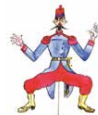
Deutsche Propaganda: Der Franzose, Grafik von Franz Reinhardt, 1915