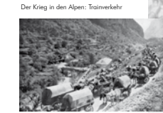
Der Krieg in den Alpen: Trainverkehr

Italien Von 1915 bis 1917 kam es am Grenzfluss Isonzo zu zwölf Schlachten zwischen italienischen und österreich-ungarischen Truppen. Beide Seiten erlitten hohe Verluste, konnten jedoch keinen entscheidenden Durchbruch erzielen. Nach dem Scheitern der letzten großen Offensive 1917 gingen die Kampfhandlungen in einen Stellungskrieg über.