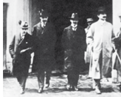
Die deutsche Delegation in Versailles 1919

Am 18. Januar 1919 begann in Paris eine Friedenskonferenz der Siegermächte ohne Vertreter der besiegten Nationen. Im Verlauf der Verhandlungen traten die von Wilson proklamierten „Vierzehn Punkte“ zugunsten der in Geheimverträgen der Entente festgelegten Kriegsziele immer mehr zurück. Bis August 1920 wurden in verschiedenen Pariser Vorverträgen Friedensverträge mit den unterlegenen Staaten geschlossen.