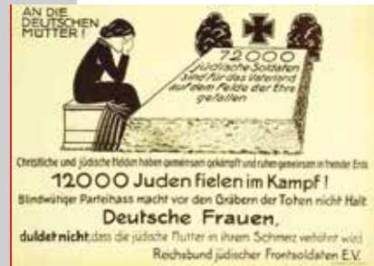
Flugplatz des Reichsbundes jüdischer Frontsoldaten von 1920

Christliche und jüdische Helden haben gemeinsam gekämpft und ruhen gemeinsam in ewiger Eise. 12000 Juden fielen im Kampf! Blindwähiger Parteihass macht vor den Gräbern der Toten nicht Halt. Deutsche Frauen, duldet nicht, dass die jüdische Flut in ihrem Schutze verkehrt wird. Reichsbund jüdischer Frontsoldaten E.V.