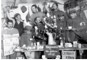
Feldpostkarte Weihnachten in Ost Galizien, 1915

Die Feldpost war die einzige Möglichkeit der Frontsoldaten, die Verbindung zur Heimat aufrechtzuerhalten. Auch heute noch bewahren viele Familien Feldpostkarten aus dem Ersten Weltkrieg auf. Die Motive – offizielle Fotografien – zeigen zumeist ein positives Bild vom Krieg. Die Mitteilungen der Soldaten an ihre Angehörigen unterlagen der Zensur der Militärbehörden. Sehr wichtig waren die Pakete aus der Heimat an die Front mit Lebensmitteln und Kleidungsstücken. Auch Firmen sandten diese „Liebesgaben“ an ihre eingezogenen Mitarbeiter.