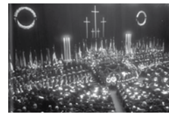
Gedenkfeier im Reichstag für die Toten des Ersten Weltkrieges, 1932