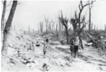
So sah die Realität an der Westfront aus: ein gestürmter Hohlweg bei Bapaume an der Somme. Im Hintergrund die durch Artilleriebeschuss zerstörte Landschaft