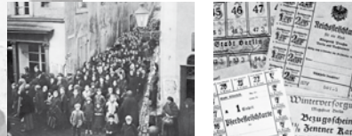
Linkes Bild Bezugsheine für Lebensmittel. Nach dem „Steckrübenwinter“ 1916/17 brachen in Deutschland Hungerstreiks aus