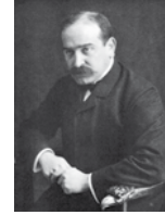
Rechtes Bild Der Bankier Max Warburg