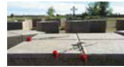
Granitblöcke mit Namen der Toten und Vermissten auf einer Kriegsgräberstätte in Russland

Seit seiner Gründung hat der Volksbund in 45 Staaten 827 Friedhöfe für 2.500.000 Gefallene und andere Opfer der beiden Weltkriege gebaut. Für ihre Instandhaltung wendet er jährlich etwa 40 Millionen Euro auf. Diese Summe stammt zu 75 Prozent aus Spenden und Mitgliedsbeiträgen, nur zu einem kleineren Teil aus Mitteln der Bundesregierung. Heute, sieben Jahrzehnte nach Ende des Zweiten Weltkrieges, betreut der Volksbund ungefähr 750.000 Angehörige und beantwortet durchschnittlich 30.000 Anfragen zur Klärung von Schicksalen Vermisster pro Monat. Seit der Grenzöffnung in Osteuropa kann der Volksbund jährlich immer noch 30.000 bis 50.000 Tote bergen. Europakarte mit deutschen Kriegsgräberstätten