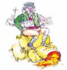
Deutsche Propaganda: Der Engländer, Grafik von Franz Reinhardt, 1915

Die Wahrheit als Opfer Wichtigste Bestandteile der psychologischen Kriegsführung sind Zensur und Propaganda. Damit ist es möglich, die Wahrnehmung des Geschehens von der Realität so weit zu lösen, dass in den Köpfen das jeweils gewünschte Bild entsteht. Dieses muss grundsätzlich das eigene Handeln als notwendig und gerecht, das des Feindes als ungerechtfertigt darstellen. Im Ersten Weltkrieg entwickelte sich die Propaganda im Kontext der industriellen Massengesellschaft ebenfalls zu einer Materialschlacht. Die kriegführenden Staaten intensivierten ihre Anstrengungen in dieser Hinsicht im Verlauf des Krieges und nutzten die inzwischen verfügbaren technischen Mittel und Werbemethoden. Die Alliierten waren den Mittelmächten dabei deutlich überlegen.