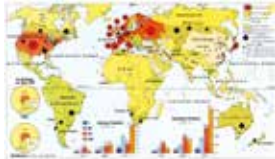
Kolonialmächte und Kolonien im Jahr 1914

Das Machtstreben der europäischen Staaten im späten 19. und frühen 20. Jahrhundert löste eine Abfolge von Krisen und Entspannungsgersuchen aus. Die Bündnispolitik der wichtigsten Akteure – Deutschland, Frankreich, Großbritannien, Österreich-Ungarn und Russland – lief langfristig auf die Bildung zweier Blöcke hinaus. Die „Mittelmächte“ Deutschland und Österreich-Ungarn standen der „Entente“ von Frankreich, Großbritannien und Russland gegenüber. Deutschland, inzwischen die stärkste Industrienation Europas, befand sich in einem Rüstungswettlauf mit Frankreich und Großbritannien. Österreich-Ungarn und Russland waren außenpolitische Kontrahenten auf dem Balkan, der sich zum Krisenherd der Weltpolitik entwickelte.