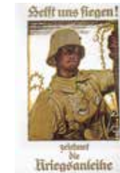
Werbeplakat für die sechste Kriegsanleihe März 1917, Fritz Erler

Österreich-Ungarn, Russland und Deutschland deckten ihre Kriegskosten im Wesentlichen durch Kriegsanleihen ab – Kredite, die jedermann dem Staat gewähren konnte. Das Deutsche Reich legte von 1914 bis 1918 insgesamt neun Kriegsanleihen auf. Diese brachten 98 Milliarden Reichsmark ein, was ungefähr 60 Prozent der deutschen Kriegskosten entsprach. Die Kriegsanleihen begleitete jeweils ein erheblicher Werbeaufwand. Die betreffenden Plakate und Annoncen gestalteten oft namhafte Künstler.