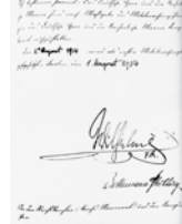
Mobilmachungserklärung mit der Unterschrift Wilhelms II.

Nach der Kriegserklärung Österreich-Ungarns an Serbien arbeiteten die politische und die militärische Führung Deutschlands gegeneinander. Ein Vermittlungsversuch des Reichskanzlers scheiterte, die Militärs drängten zum Krieg. Die Mobilmachung begann, weitere Kriegserklärungen folgten.