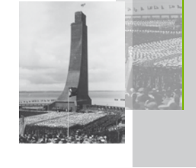
Einweihung des Marine-Ehrenmals in Laboe, 1936

Für die Verherrlichung des Krieges und die Verbreitung der „Dolchstoßlegende“ sorgten auch etliche der fast 30.000 Kriegervereine, die es in Deutschland gab. Oft setzten sie sich auch für den Bau von Kriegerdenkmälern ein. Da die meisten Gefallenen in den Kampfgebieten beigesetzt worden waren, erhielten die Denkmäler als Erinnerungsstätten in der Heimat große Bedeutung. Den anfangs zumeist schlicht gehaltenen Mahnmälern folgten im Laufe der 1920er-Jahre aufwendigere, zum Teil kriegerisierende Formen. Die der Arbeiterbewegung nahestehenden Organisationen versuchten, dieser Entwicklung mit dem Aufbruch „Nie wieder Krieg“ entgegenzuwirken, der auch auf einigen ihrer Denkmäler zu finden war.