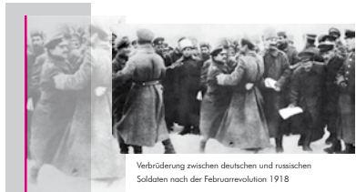
Verbrüderung zwischen deutschen und russischen Soldaten nach der Februarrevolution 1918