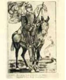
Beide Abbildungen: Das Bild des deutschen Soldaten in der französischen Kriegspropaganda

Die französische, britische und später auch die amerikanische Kriegspropaganda stellte die Deutschen als eine gefräßige, gewalttätige, grobschlächtige und militarische „Rasse“ dar. Insbesondere Frankreich verbreitete das Bild der „boches“ als mordlüsterne Barbaren; in Großbritannien bezeichnete man sie als „Huns“ – Hunnen. Die deutsche Propaganda fand in England, dem „perfiden Albion“, ihr Hauptfeindbild. Die Engländer wurden als „Händler“ und „Kramseelen“, als traurige, unsportliche Gestalten verspottet.