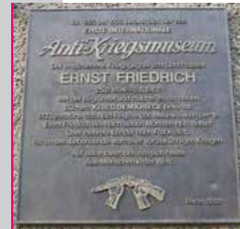
Gedenktafel für den Pazifisten Ernst Friedrich in Berlin

Der deutsche Antimilitarist und Pazifist Ernst Friedrich veröffentlichte 1924 ein Buch mit dem Titel „Krieg dem Kriege“. Mit vielen Fotos von verwundeten und grauenvoll verstümmelten Soldaten zeigte er darin das wahre Gesicht des Krieges. Um die Wirkung zu erhöhen, kombinierte Friedrich die Bilder mit Zitaten von ranghohen deutschen Militärs, so den Ausspruch Hindenburgs: „Der Krieg bekommt mir wie eine Bodekur“. Friedrichs Buch, das schnell zur „Bibel“ aller Pazifisten wurde, erschien viersprachig – auf Deutsch, Französisch, Englisch und Niederländisch.