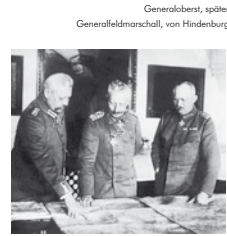
Generaloberst, später Generalfeldmarschall, von Hindenburg