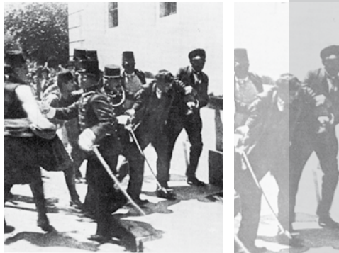
Festnahme eines Verdächtigen nach dem Attentat von Sarajevo. Dieses Foto zeigt nicht, wie lange angenommen wurde, die Verhaftung des Attentäters Gavrilo Princip

Auf dem Balkan hatte der Verfall des Osmanischen Reiches den Aufstieg neuer Nationalstaaten, darunter Serbien, begünstigt. Diese standen dem weiteren Vormachtstreben Österreich-Ungarns im Wege, das auch Italien kritisch sah. Russland wiederum unterstützte Serbien. Am 28. Juni 1914 erschoss der bosnische Student Gavrilo Princip den österreichischen Thronfolger, Erzherzog Franz Ferdinand, und dessen Frau in Sarajevo. Prinzip war Mitglied einer Geheimorganisation namens „Schwarze Hand“. Diese kämpfte für ein großserbisches Reich unter Einchluss von Bosnien und der Herzegowina. Deutschland sicherte Österreich-Ungarn seine Bündnistreue zu. Dessen weitreichende Forderungen zur Beilegung der Krise lehnte Serbien teilweise ab. Daraufhin erklärte Österreich-Ungarn Serbien am 28. Juli 1914 den Krieg.