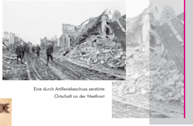
Eine durch Artilleriebeschuss zerstörte Ortschaft an der Westfront

und, vor allem, der Verlust an Menschenleben sind zu nennen. Die klaren Vorgaben der Haager Konvention von 1907 über die „Gebäude im Landkrieg“ fanden in den Anfangsjahren in den Besatzungsgebieten noch weitgehende Beachtung. Mit zunehmender Dauer des Krieges wurde der Umgang der Besatzer mit der Zivilbevölkerung brutaler.