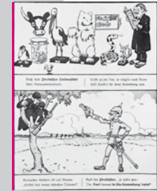
Aus dem Buch „Das Volk steht auf... Deutsche Verse mit Bildern für deutsche Kinder“ von 1915, Zeichnungen von Paul Simmel