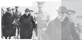
Frankreichs Kriegsheld General Foch und Ministerpräsident Georges Clemenceau

In den kriegführenden Staaten wuchs die Kritik – auch der Parlamente – an den Regierungen und löste Krisen aus. In Großbritannien stürzte 1916 die liberale Regierung. Ein sogenanntes Kriegskabinett unter Premierminister David Lloyd George wurde gebildet. In Frankreich führten Streiks in der Metallindustrie zu einer Meuterei, an der sich 16 Armee Korps beteiligten. Der Aufstand wurde niedergeschlagen und eine neue Regierung gebildet. Ministerpräsident Georges Clemenceau regierte mit harter Hand und schuf so die Voraussetzungen für den französischen Sieg. Österreich-Ungarn erschütterte 1916 der Tod Kaiser Franz Josephs. Den Autonomiebestrebungen der Tschechen und Südslawen wollte sein Nachfolger Karl I. mit einer Versöhnungspolitik begegnen, die aber scheiterte. In Deutschland führte der Streik um eine demokratische Umgestaltung der Reichsverfassung zu heftigen innenpolitischen Kämpfen.