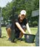
Jugend-Workcamp in Frankreich

Am Ende jedes Jahres findet die traditionelle Haus- und Straßensammlung des Volksbundes statt. Sie wird getragen von der Bundeswehr, Schulklassen und Persönlichkeiten des öffentlichen Lebens sowie vielen anderen ehrenamtlichen Sammlern.