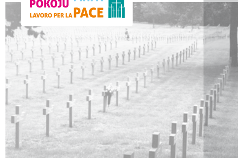
Friedhof Ysselstein, Niederlande. Mehr als 30.000 deutsche Kriegstote sind hier begraben

ARBEIT FÜR DEN FRIEDEN TRAVAIL POUR LA PAIX WERK VOOR DE VREDE PRACA DLA POKOJU LAVORO PER LA PACE