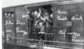
Deutsche Einberufene und Freiwillige auf dem Weg zum Kriegsgraben

Die öffentliche Meinung in Deutschland sah den Ersten Weltkrieg überwiegend als Verteidigungskrieg. Es galt als patriotische Pflicht, ins Feld zu ziehen und für die gerechte Sache, für das Vaterland zu kämpfen und zu sterben. Sicher gab es in allen gesellschaftlichen Gruppen auch skeptische und sogar mahnende Stimmen. Aber besonders in der Anfangszeit des Krieges überwog eine nationalstische, zuweilen euphorische Haltung. Einige sahen den Krieg sogar als Möglichkeit, dem faden Alltagsleben zu entkommen. „Krieg ist wie Weihnachten und eine Chance zur Selbstverwirklichung“ (ein deutscher Offizier 1914). Die Realität in den Schützengräben sah anders aus.