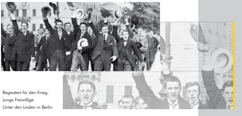
Begeistert für den Krieg: Junge Freiwillige Unter den Linden in Berlin

Kalte Krieg zwischen beiden folgten. Erst die deutsche Wiedervereinigung und der Niedergang der Sowjetunion leiteten das Ende dieser konfliktreichen Ära ein. Doch genauso, wie die Weltpolitik der europäischen Staaten im 19. Jahrhundert genug Konfliktpotenzial anhäufte, um den Ersten Weltkrieg auszubringen zu lassen, wirken dessen Folgen noch über das späte 20. Jahrhundert hinaus. Die Auseinandersetzungen im Nahen Osten und auf dem Balkan in jüngerer Zeit belegen dies. Der Erste Weltkrieg führte aber auch zur Gründung des Völkerbundes, der weitere derartige Katastrophen verhindern sollte und der heute in Gestalt der Vereinten Nationen fortexistiert.