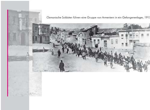
Osmanische Soldaten führen eine Gruppe von Armeniern in ein Gefangenlager, 1915

In den Jahren 1915 und 1916 kam es unter Verantwortung der türkischen Regierung zu einem Genozid an den Armeniern, damals eine christliche Minderheit im osmanischen Reich. Bei Massakern und Todesmärschen kamen mehrere hunderttausend Menschen ums Leben, die genaue Zahl ist unstritten. Bereits im 19. Jahrhundert hatte es mehrfach Übergriffe auf die Armenier gegeben. Auslöser für die Ereignisse im Ersten Weltkrieg war deren angebliche Parteinahme für Russland. In der Türkei gilt die Deportation der Armenier offiziell heute noch als „kriegsbedingte Sicherheitsmaßnahme“. Logistisch war daran auch das deutsche Militär beteiligt.