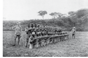
Der Krieg in den Kolonien: Deutsche Offiziere mit „Askari“ – einheimischen Kolonialsoldaten. Mit Ausnahme Deutsch-Ostafrikas unterlagen die deutschen „Schutztruppen“ den Alliierten in den Kolonien nach relativ kurzer Zeit

Italien Von 1915 bis 1917 kam es am Grenzfluss Isonzo zu zwölf Schlachten zwischen italienischen und österreich-ungarischen Truppen. Beide Seiten erlitten hohe Verluste, konnten jedoch keinen entscheidenden Durchbruch erzielen. Nach dem Scheitern der letzten großen Offensive 1917 gingen die Kampfhandlungen in einen Stellungskrieg über.