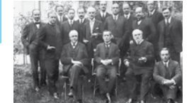
Das Komitee zur Vorbereitung der Völkerbundsgründung bei seiner ersten Sitzung, 1920

Die Vollversammlung der Versailler Friedenskonferenz nahm am 28. April 1919 die Satzung des Völkerbundes an. Am 28. Juni folgte die Unterzeichnung der 26 Artikel durch die Gründungsstaaten; die Satzung wurde Bestandteil des Versailler Vertrages. Im Januar 1920 nahm der Völkerbund in Genf die Arbeit auf. Als Weltorganisation freier Völker diente der Bund der Sicherung des Friedens und der internationalen Zusammenarbeit. An die Stelle einzelstaatlicher Gewaltpolitik sollte die kollektive Gewaltanwendung aller Staaten gegen einen Aggressor treten. Der Völkerbund erfüllte diese Aufgaben nicht und wurde 1946 aufgelöst. Schon im Juni 1945 waren die Vereinten Nationen – UNO – als neue Weltorganisation ins Leben gerufen worden.